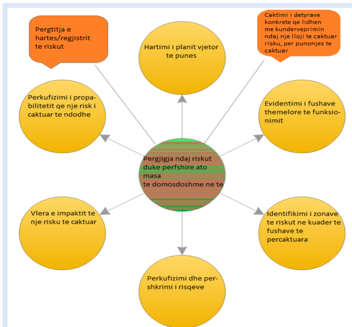
Fig. 1 - Skema e menaxhimit të riskut